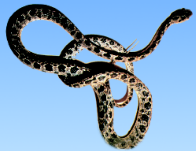
งูแม่ตะงาว