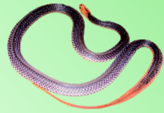
งูสามเหลี่ยมหัวแดงหางแดง