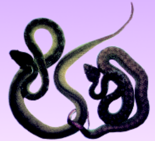
งูเขียวหางไหม้ท้องเหลือง (ซ้ายมือ) ท้องสีฟ้า (ขวามือ)