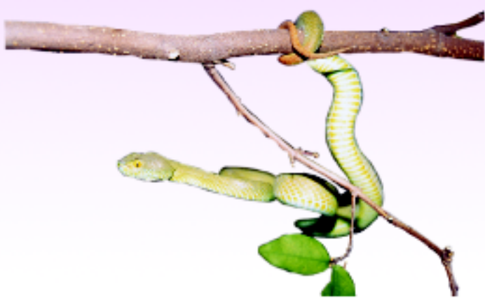
งูเขียวหางไหม้ตาโต