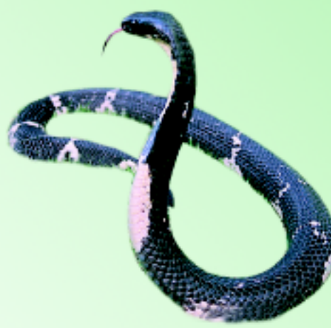
งูเห่าดำพ่นพิษ