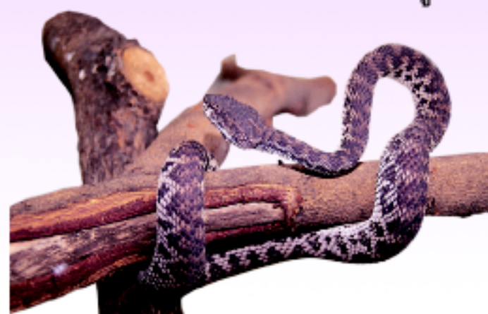
งูเขียวหางไหม้ลายเสือ