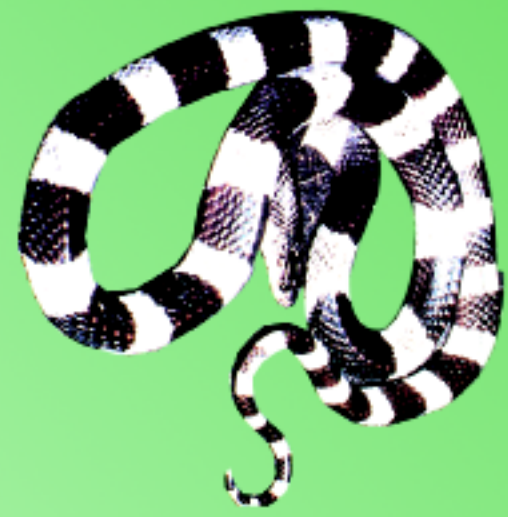
งูทับสมิงคลาลายดำสลับขาว (ลายดำคาดไม่รอบตัว)