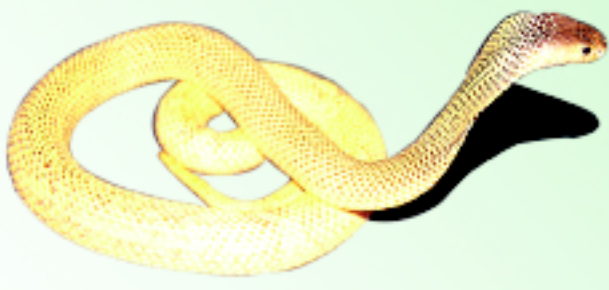
งูเห่าพ่นพิษสีทอง