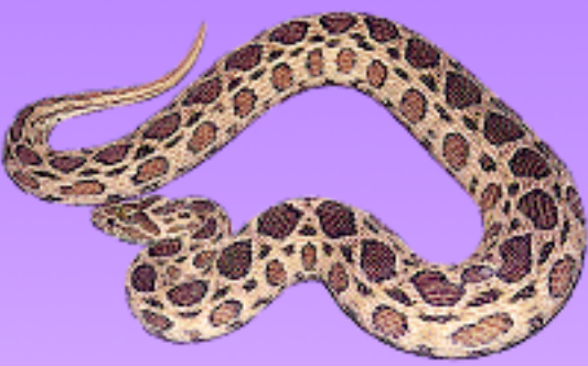
งูแมวเซา