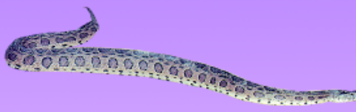
งูแมวเซา ลายเป็นวงกลมตามแนวลำตัว