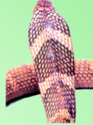
งูจงอาง (ด้านหลัง) มีเกล็ดที่หัวสูง เป็นชั้นใหญ่ 2 ชั้นชัดเจน ด้านหลังมีรูปคล้ายกังปลา หรือเครื่องหมายศร่า