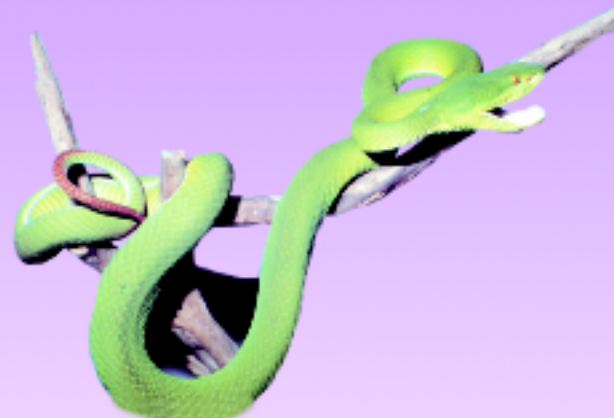
งูเขียวหางไหม้ท้องสีเหลือง