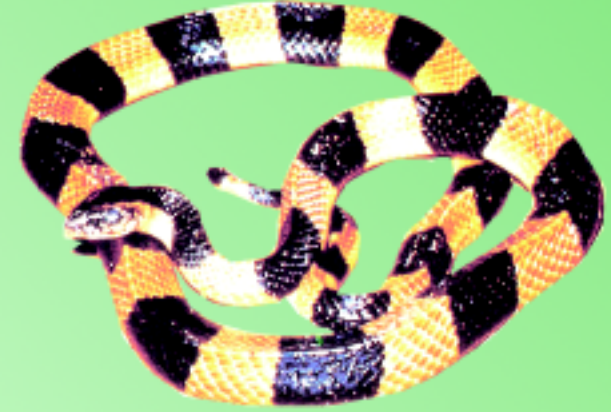
งูสามเหลี่ยม ลายดำสลับกับเหลือง (ลายดำคาดรอบตัว)