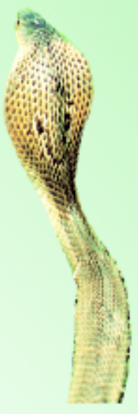
งูเห่า (ชนิดพ่นพิษ) ดอกจันเป็นรูปตัว "U"