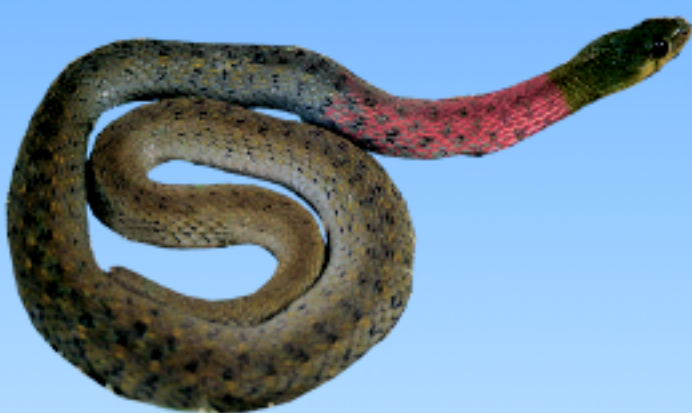
งูลายสามคอดแดง